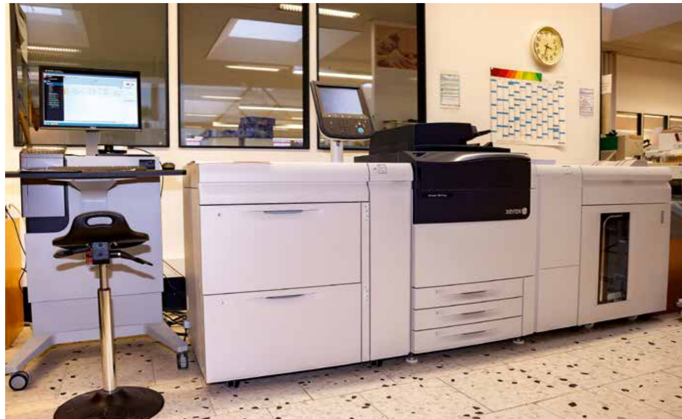
Von außen unspektakulär, doch der „Xerox Versant 180 Press“ im ISM-Copyshop kann deutlich mehr als sein Vorgänger.

die Datei mit dem Namen „Poster_ToT“ aus. Es erscheint ein Fenster mit verschiedenen Druckprofilen für Poster, Postkarten oder Broschüren. „An der alten Maschine gab es nicht so viele Einstellungsmöglichkeiten“,