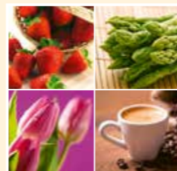
Jahreszeiten auf Gut Kinderhaus