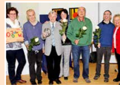
2015 Zehn Jahre Wohngruppe Otto-Hersing-Weg.