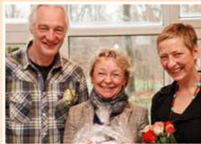
2011 Verabschiedung aus ihrer Zuständigkeit für den Sozialen Dienst der Werkstatt.