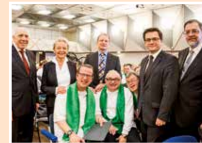
2015 Festakt 90 Jahre Westfalenfleiß in der Stadthalle Hilstrup.