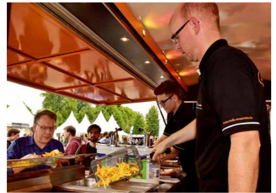
Zahlreiche Portionen Pommes wurden am Veranstaltungstag verkauft.