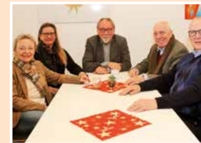
2016 Tag der offenen Tür in der Werkstatt am Kesslerweg.