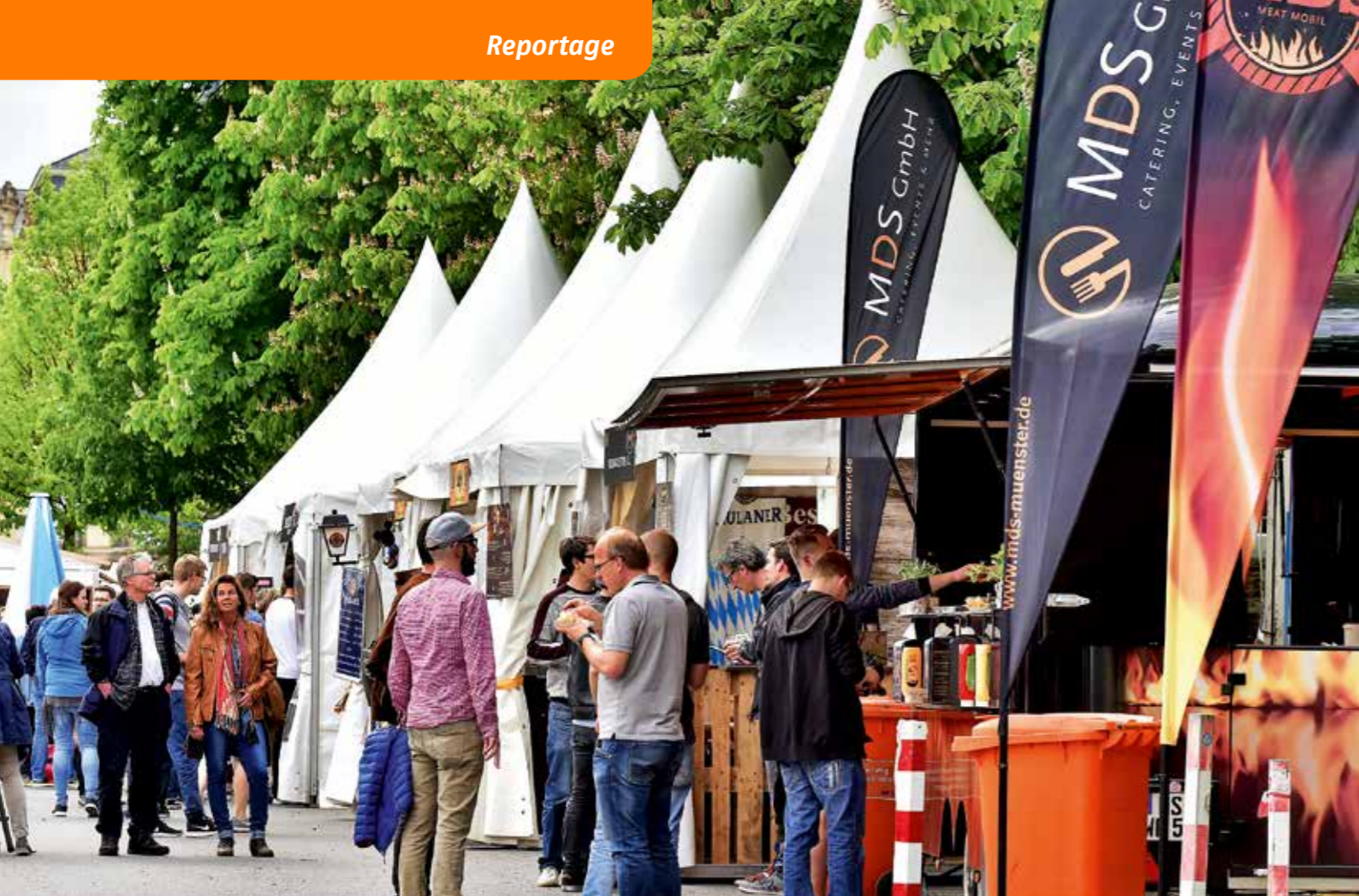
Der MDS-Stand beim Münsteraner Bierfest war schon zu früher Stunde gut besucht.