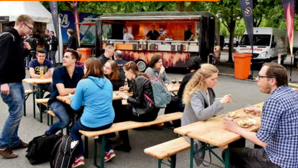
Die Bänke vor dem MDS-Stand waren die ganze Zeit mit Gästen besetzt, die sich eine Currywurst oder Pommes geholt hatten.

haben, können wir im Fall der Fälle schnell Nachschub holen.“ Doch: Die Warenmenge, die an den drei Festtagen voraussichtlich gebraucht wird, muss Rietmann kalkulieren. Und das sind für alle drei Tage mehrere Tausend Würstchen und ein halbes Kühlhaus voller Pommes.